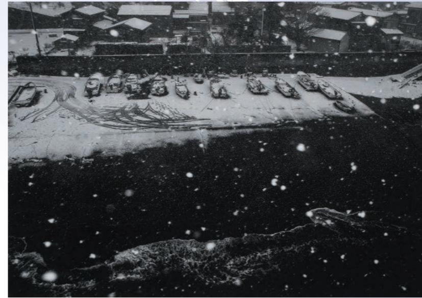
【第17回秋艸道人賞 受賞作品】 安部 論氏(新潟市中央区) 「帰り来て 夢なほ浅き ふるさとの 枕とよもす 荒海の音」

公益財団法人 會津八一記念館 〒950-0088 新潟市中央区万代3丁目1の1 メディアシップ5階 TEL.025-282-7612 FAX.025-282-7614 info@aizuyaichi.or.jp