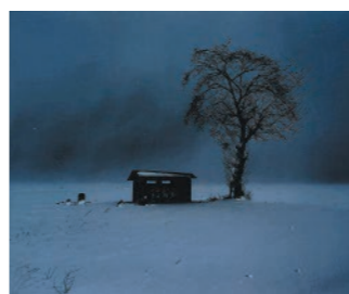
【新潟市長賞】 大滝登氏(新潟市西区) 「み雪降る 冬の長夜を つつららに 国上の里」 思ほゆるかも