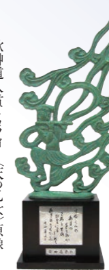
前文化庁長官 宮田亮平氏作