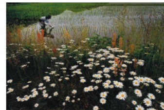
【新潟日報社賞】 渡邊隆氏(新潟市西区) 「わが友よ よき文緒れ 水田の畔に 読む人のため」