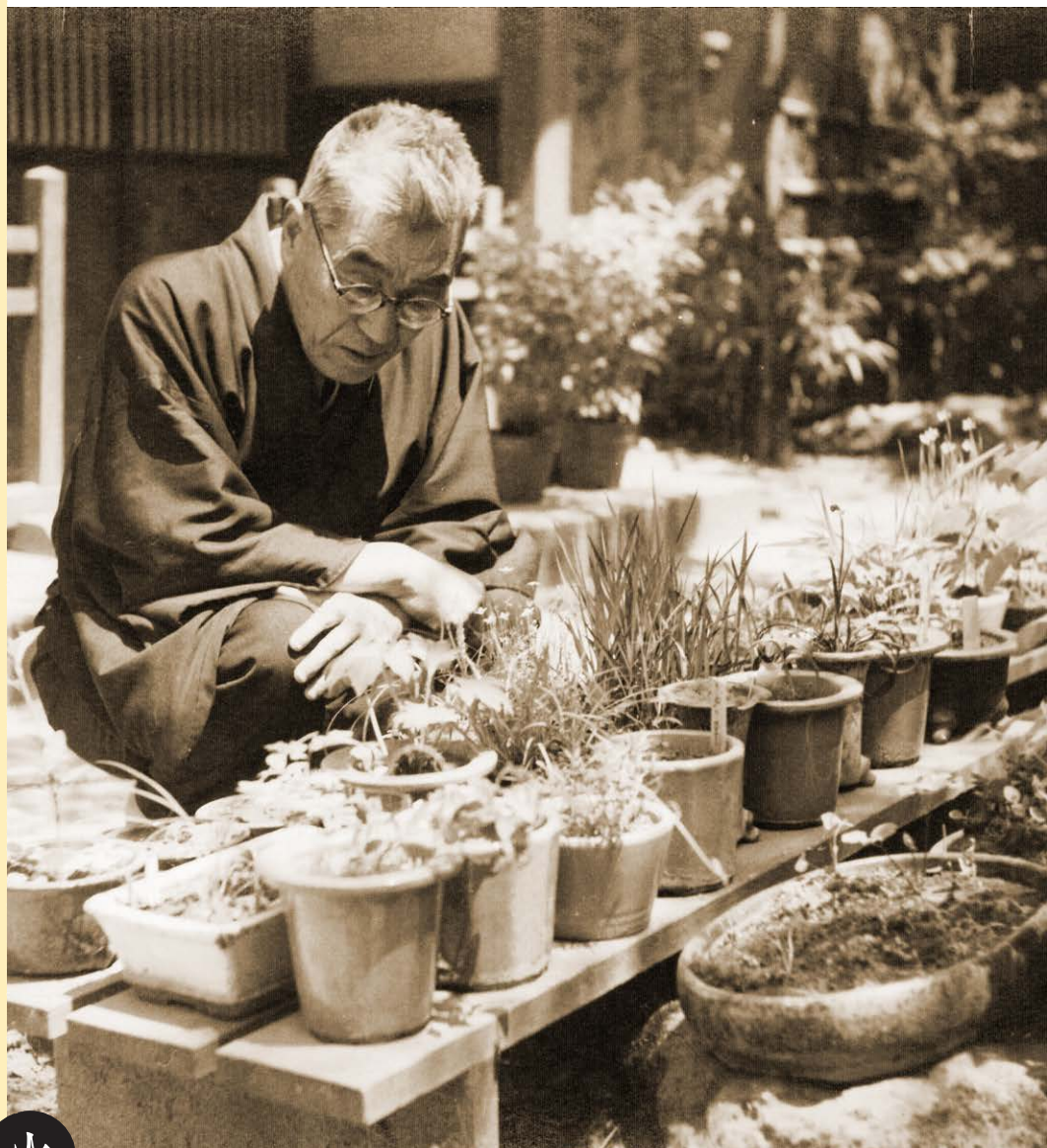
晩年の會津八一（自宅にて、昭和30年頃）