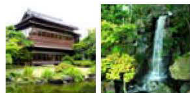
本因坊戦の対局も行われた文化遺産 庭では大小2つの滝が心地よい水音を奏でる

1300坪という広大な敷地の半分以上を占めるのが、美しい池を中心に築山の木々に囲まれた、この世の別天地を思わせる日本庭園。住宅街の中であたかも深山に分け入ったかのような気分を味わうことができる。