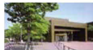
新潟市生まれの建築家・前川國男が設計

当地区の緑化スポットの中心に位置する美術館。向かいは西大畑公園で、その景観の良さと前川國男設計のオリブグリーンの落ち着いた建物が市民に親しまれている。さまざまなジャンルの企画展の他、新潟ゆかりの作家や近現代美術を中心にしたコレクション展を開催。天気の良い日は野外彫刻の散歩道を散策するのもおすすめ。